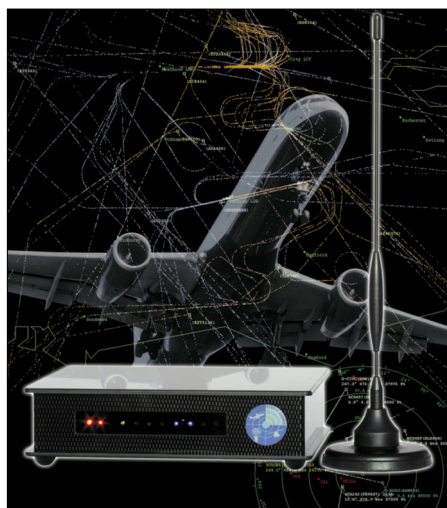
Titelbild des FA 2/06 mit dem Beitrag [4]

Der Annahme der Behörde, die Benutzung des SBS-1 verstoße gegen §§ 89, 148 TKG und sei strafbar, kann nicht gefolgt werden. Es sei bereits zweifelhaft, ob die von dem Gerät empfangbaren Signale des Navigationsfunks Nachrichten sind, die dem Anwendungsbereich der Norm unterfallen. Das Gericht erklärte der Bundesnetzagentur sodann einige technische Zusammenhänge. Es führte aus, dass die empfangenen Signale des Flugnavigationfunks durch die Software auf dem PC-Bildschirm optisch wie Flugbewegungen auf einen Radarschirm in Echtzeit ausgegeben, also sichtbar gemacht werden. Eine akustische Wahrnehmung des Navigationsfunks oder des Funkverkehrs der Flugzeuge ist mit dem